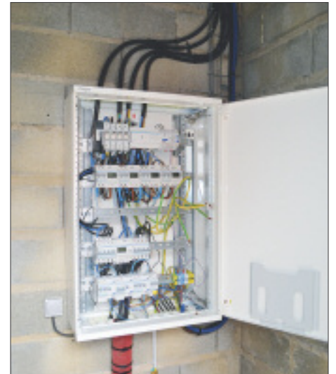
...qui contient l'arrivée de l'électricité et les connexions des 4 logements.

J'approuve votre projet et désire faire partie de l'