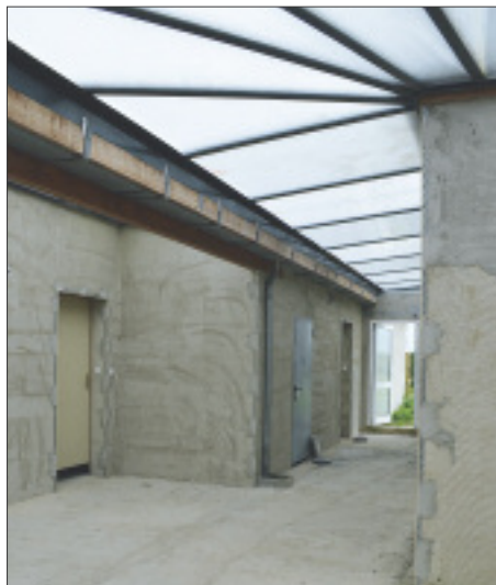
Le couloir d'entrée. Au centre le local technique...