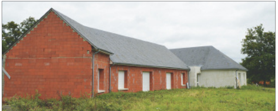
Le chantier en Juillet 2016.

Ste Thérèse d'Avila Livre des Fondations, chap. 4, 5