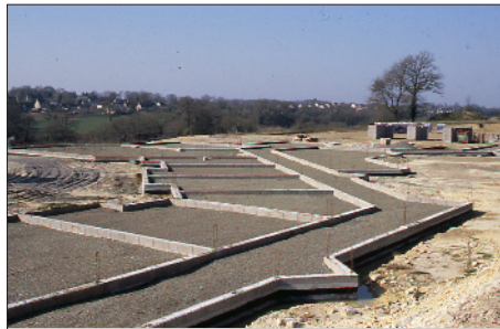
Mars 2003 – Les fondations sont achevées.