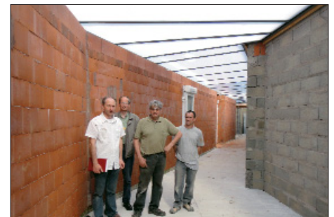
Visite du chantier le 26 Avril 2011.