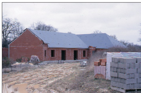
Mars 2008 – Tout le gros-œuvre est achevé.

Combien êtes-vous à vivre actuellement en maison de retraite disons... officiel- le... Vous nous écrivez que vous ne manquez de rien, on vous fait chanter, danser ! une seule chose vous manque cependant et cela déchire vos cœurs : Dieu ! Le grand absent de notre société laïcisée... Et c'est justement notre Dieu adorable que nous voulons mettre à la première place dans cette maison ! Aidez-nous donc à concrétiser ce projet le plus vite possible pour que la maison Marthe et Marie soit véritablement un havre de paix et de joie.