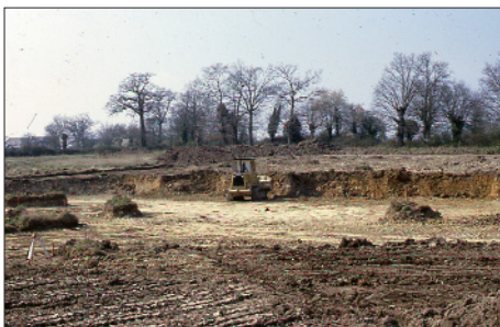
Mars 2002 – Premiers travaux de terrassement. On enlève 1 700 m 3 de terre.

C'est justement pour remédier à cette misère grandissante que nous voulons nous hâter d'achever ces six premiers logements.