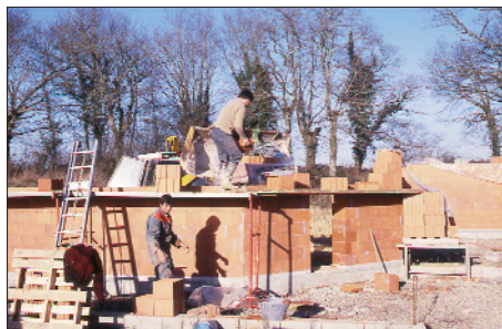
Février 2005 – Les murs sortent de terre.