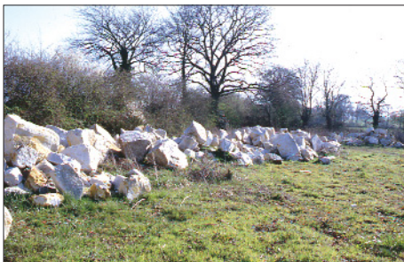
Mars 2003 – Ces blocs de rochers calcaires découverts au cours du terrassement seront utilisés pour bâtir une grotte de Lourdes.